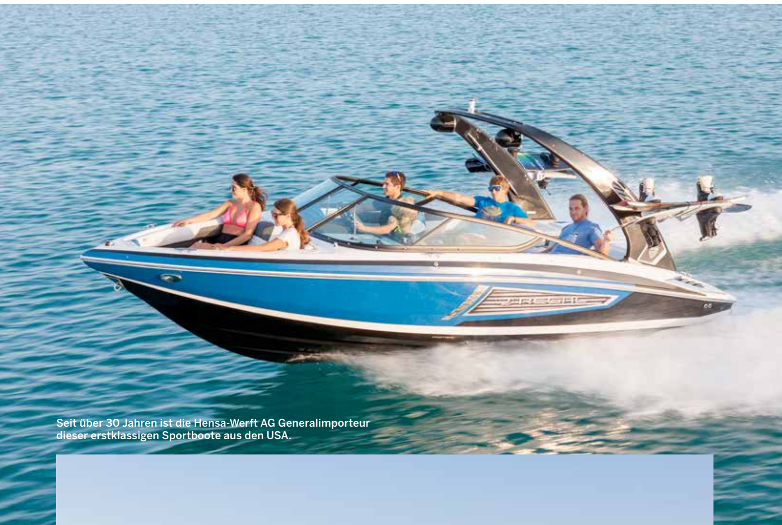
Seit über 30 Jahren ist die Hensa-Werft AG Generalimporteur dieser erstklassigen Sportboote aus den USA.